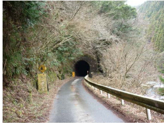
◀設楽ダム予定地調査 (3月13日)