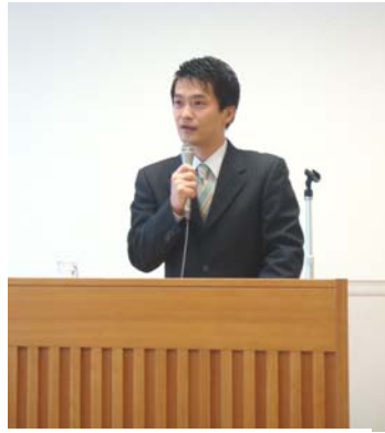
▲小川淳也総務大臣政務官より地域主権について学習