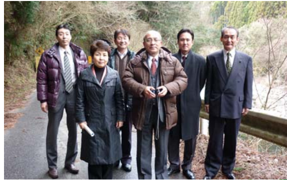
3月30日CBC「いっぽう」で放映されました