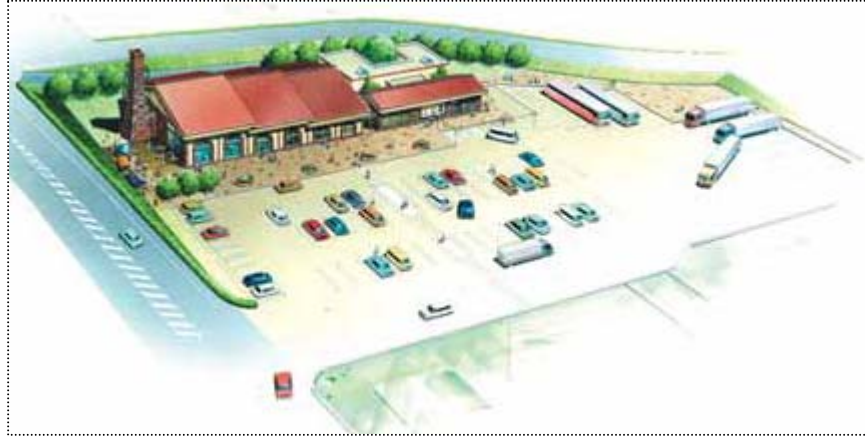
▲昨年より民主党幹事長室へ地域の要望活動を行いました品野陶磁器センター隣接地の「道の駅」については、3月26日国土交通省発表で交付金決定しました。