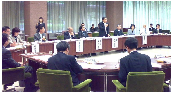
5月22日の障害者差別禁止条例PT 意見交換会

※昨年度、障害者の方々からの意見をうかがった「障害者差別禁止条例PT」では、本年度は法曹・医療・労働・教育・交通・経済界等の各分野の団体との意見交換を行い、条例の提案をめざしています。