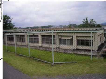
工事の始まる窯業高校校舎

○介護職員の処遇改善を進めるための基金の設置 ★介護職員処遇改善等臨時特例基金積立金(事業終了平成23年度まで) ・・・約250.7億円