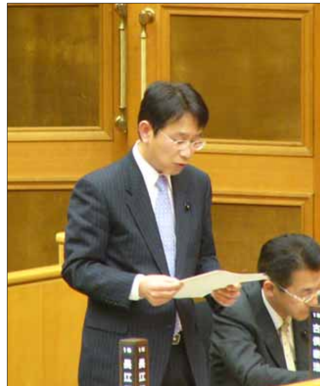
愛知県庁議場から

この県政レポートは、県民のみなさまからご意見・ご要望をいただくための情報提供を目的に、民主党愛知県議員団に交付されている政務調査費の広報費を充当して製作・配布しています。